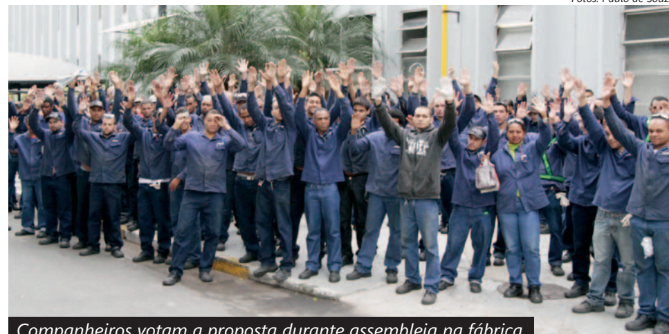
Companheiros votam a proposta durante assembleia na fábrica